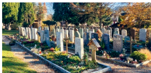
Die Gräber auf den Friedhöfen, deren Grabesruhe Ende 2024 abläuft, werden im Februar/März 2025 geräumt.

nen gemäss den Bestimmungen des Friedhofreglements nachträglich nicht mehr geltend gemacht werden. Granitplatten bleiben im Eigentum der Politischen Gemeinde. Die Gemeinde lehnt jede Verantwortung und Haftung ab.