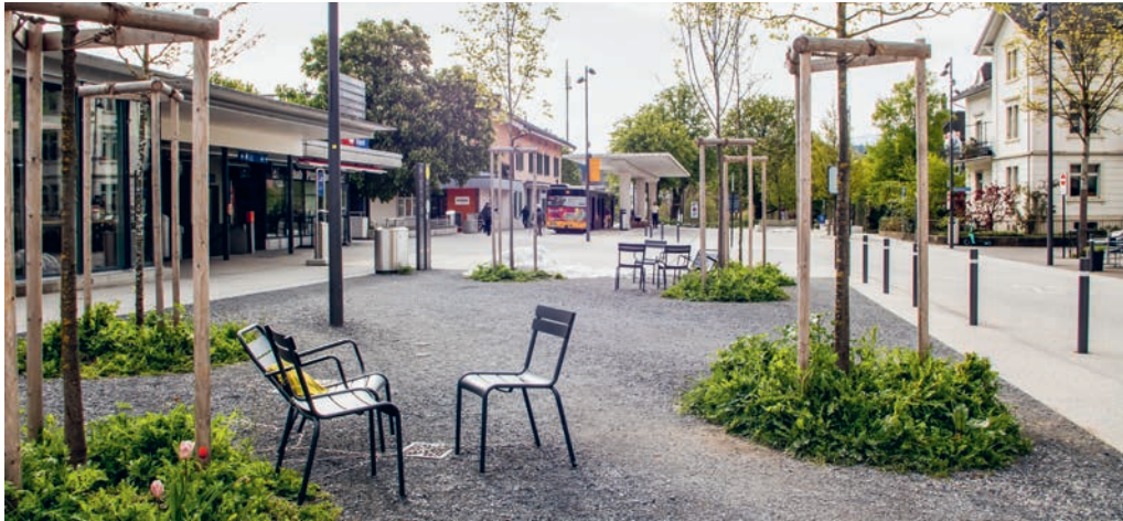
«Entsiegelung» am Bahnhofplatz: Die Betonverbundsteine wurden mit der Neugestaltung entfernt und durch wasserdurchlässige Kräutermatten und Kies ersetzt.

FLAWIL Der Gemeinderat Flawil hat die Energiefördermassnahmen 2025 beraten und freigegeben. Der Fokus der Fördermassnahmen 2025 liegt auf der Wärmedämmung von Gebäuden, dem Ersatz von fossilen und elektrischen Heizungen durch Fernwärme sowie der «Entsiegelung».