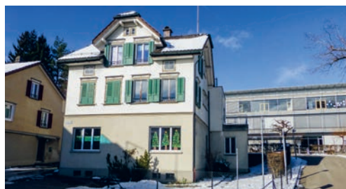
Die Schulergänzende Betreuung ist ab dem 3. Februar 2024 wieder geöffnet.

erfolgt mit einer Punktekarte, die vorgängig erworben werden muss. Für Fragen steht Marianne Hälg, Leiterin Schulergänzende Betreuung, gerne zur Verfügung: marianne.haelg@degersheim.ch .