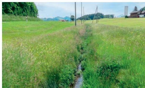
Sämtliche kontrollierten Landwirtschaftsbetriebe haben die Abstandsvorgaben eingehalten.

lisierten Kontrolldienst KUT AG abgeschlossen. Diese hat nun ihren Kontrollbericht für das Jahr 2024 vorgelegt. Der Gemeinderat ist erfreut darüber, dass bei allen kontrollierten Betrieben in der Gemeinde Degersheim keine Mängel festgestellt wurden. Ihm ist es jedoch ein Anliegen, dass nicht nur Landwirtschaftsbetriebe einen vorsichtigen Umgang mit Düngemitteln und Herbiziden pflegen. Auch im Privatbereich sollten solche Mittel nur zurückhaltend und gemäss Anweisung erfolgen.