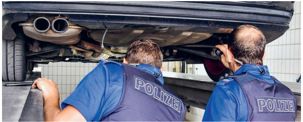
Mit der Gesetzesänderung zu Lärmbelästigungen durch Fahrzeuge geht der Bund gegen sogenannte Autoposer vor.

Inserateschluss Dienstag, 14. Januar 2025, 12 Uhr