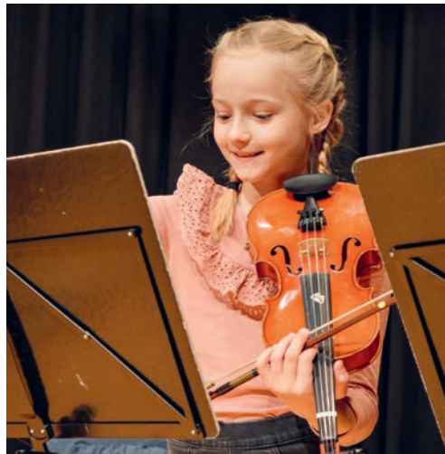
Das Leitbild der Musikschule wird bald sichtbar werden.