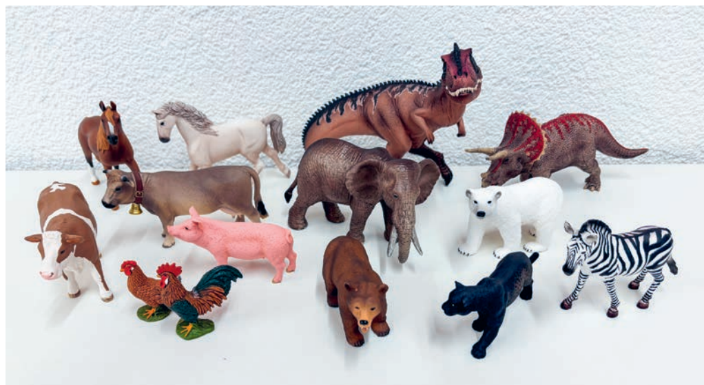
Die Schleich-Figuren gehören seit Jahren zu den beliebtesten Spielzeugen.

ten Figuren zur Ausleihe zur Verfügung und die Bibliothek Ludothek baut das Angebot stetig aus. Aktuell können vier verschiedene Boxen ausgeliehen werden: Eine Box mit Pferden, eine Box mit Dinosauriern, eine Box mit Bauernhoftieren und eine Box mit Wildtieren. Wie alle anderen Medien und Spiele in der Bibliothek Ludothek können auch die Schleichboxen für vier Wochen ausgeliehen werden, wenn ein gültiges Abonnement besteht. Dieses kostet unverändert 50 Franken pro Haushalt und ist ein ganzes Jahr gültig.