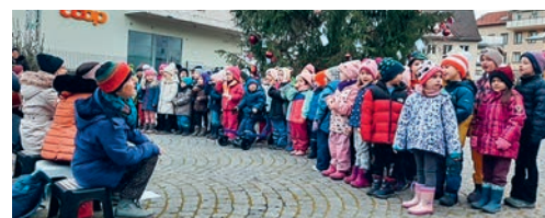
Die Kinder aus dem Kindergarten und dem Lernschloss führten das traditionelle Weihnachtssingen durch.