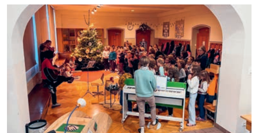
Das Montagssingen ist fester Bestandteil des Schulalltags im Sennrütischulhaus.