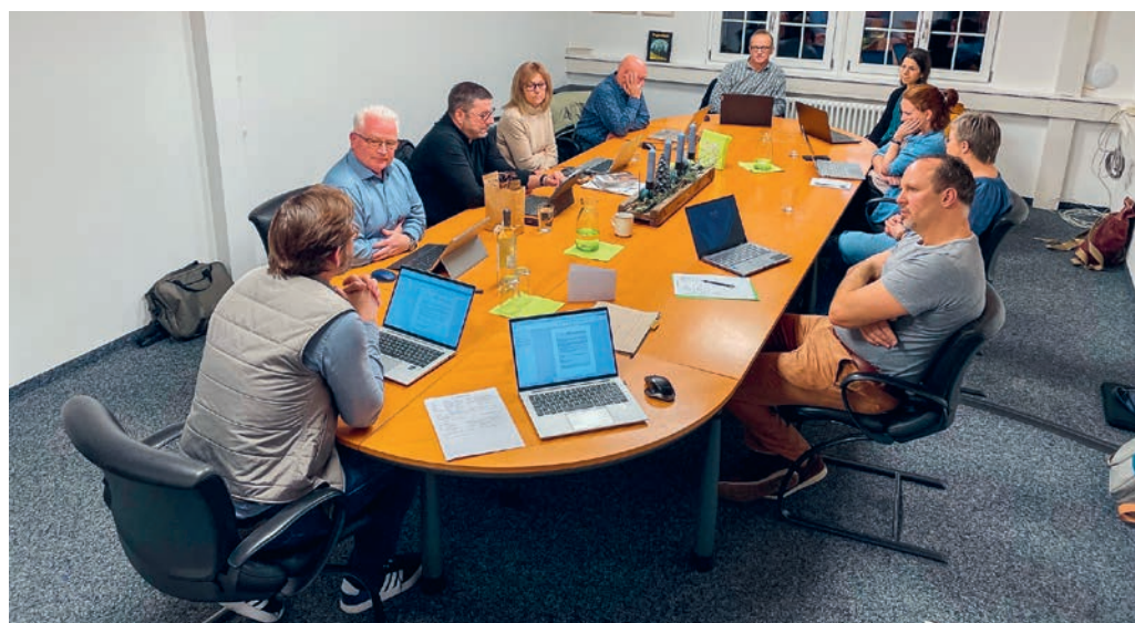
Der Gemeinderat hat sich Ende Dezember 2024 neu konstituiert.