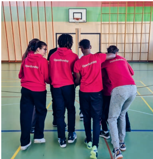
Flawiler Jugendliche planen und leiten das Spiel- und Bewegungsangebot «OpenSunday».

Bereits zum vierten Mal öffneten Ende Oktober 2024 die Türen der Turnhalle Enzenbühl für eine neue Saison des «OpenSunday» Flawils. Einmal mehr hat das Angebot bereits zahlreiche Kinder begeistert: Bisher nutzten durchschnittlich 27 Kinder pro Tag die Sonntagnachmittage in der Halle für Spiel, Spass und Bewegung. Ein Highlight war der Besuch des Superhelden «Bionicman», welcher auf spielerische Weise über sein Leben mit einer Handprothese aufklärte und beim Händeschütteln für grosse Kinderaugen sorgte. Die ab-