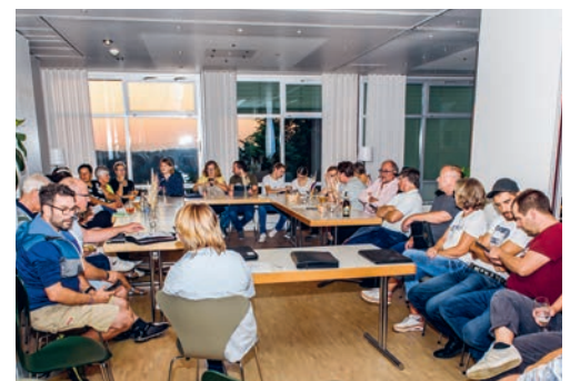
Die Vereinsvertreterinnen und -vertreter nutzen den Vereinstalk zum regen Austausch.

Ende August führte der Verkehrsverein Degersheim die jährlich stattfindende Koordinationsitzung im Hotel Wolfensberg neu als Vereinstalk durch. Dieses neue Format bot den teilnehmenden Vereinen die Möglichkeit, sich untereinander in ungezwungenen Rahmen auszutauschen und auch Anregungen anzubringen. Die ersten Zweifel, ob die Vereine dieses Angebot überhaupt nutzen oder schätzen, verflog bei den Vorstandsmitgliedern des VVD rasch. Gleich 30 Vereinsvertretungen sind erschienen und sorgten so für einen spannenden Austausch und angeregte Diskussionen. Der Verkehrsverein dankt den beteiligten Vereinen herzlich für ihre Teilnahme und freut sich bereits jetzt auf die nächste Ausgabe.