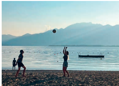
Der Sport stand im Mittelpunkt des Klassenlagers der 2a.

weg machten wir einen Zwischenstopp in Winterthur, wo wir den Skillspark besuchten. Danach durften wir einige Zeit frei durch Winterthur laufen. Mit dem Zug ging es dann weiter Richtung Degersheim. Insgesamt war es ein sehr spannendes, ereignisreiches und grossartiges Lager.»