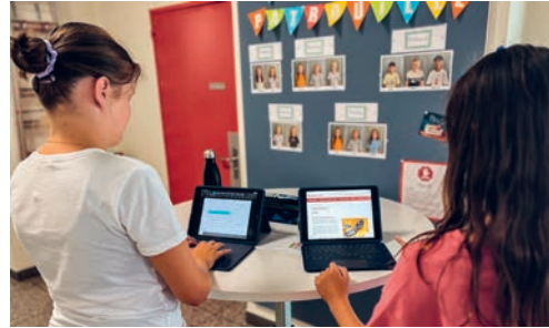
Zwei Primarschülerinnen recherchieren mit ihren iPads online über das Römische Reich.

1-to-1-Ausstattung haben die Bürgerinnen und Bürger an der Bürgerversammlung im November 2023 entschieden, die rund 110 Klassenzimmer mit neuer digitaler Präsentationstechnik auszustatten. Auch dieses Projekt befindet sich derzeit in der Umsetzung und soll spätestens 2027 abgeschlossen sein.