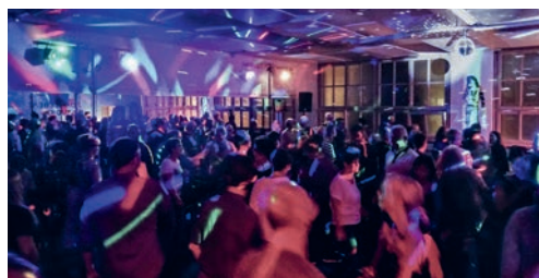
This Saturday-Night: Oldies Disco in Flawil.