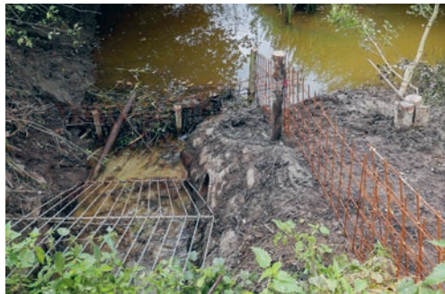
Der Biberdamm vor dem Abflussstollen hatte eine Höhe von rund 1,6 Metern und verstopfte dadurch den Durchlass.

Mit dem Ausbau des Bubentalerbaches wurde das Botsberger Riet als sogenanntes Retentionsbecken in die Projektplanung miteinbezogen. Wenn der Bubentalerbach Hochwasser führt, springt die Überfallkante bei der Brücke nahe der Firma Maestrani an und leitet die zwei Kubikme-