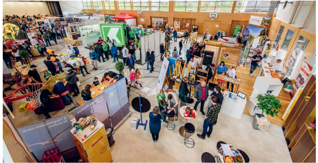
Die Gewerbeausstellung 2023 stand am Ursprung der bald stattfindenden Lehrstelleninfo.

und die teilnehmenden Betriebe freuen sich auf möglichst viele interessierte Schülerinnen und Schüler. Sollte der Anlass Anklang finden, wird er künftig alle zwei Jahre durchgeführt.