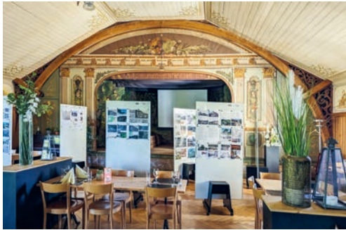
Die Ausstellung fand im altherwürdigen Saal des Rössli Magdenau statt.

DEGERSHEIM Wer etwas über die ehemaligen Tegerscher Wirtshäuser erfahren wollte, fand Ende August im Rössli Magdenau eine Ausstellung mit allerhand Wissenswertem darüber. Die Degersheimer Chronisten boten an zwei Abenden auch spannende Geschichten und Anekdoten zum Thema.