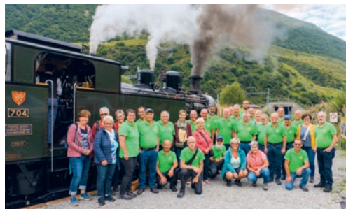
Die Reisegesellschaft am Bahnhof DFB in Realp