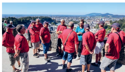
Männerriege Flawil auf der Festung Hohensalzburg.

VEREIN Die Männerriege begab sich auf den Weg nach Salzburg. Beim Halt in Isny wurden wir herzlich willkommen geheissen und bekamen ein leckeres bayrisches Frühstück serviert. Ein nächstes Highlight war der «Hangar 7». Die Formel-1-Boliden und «verrückten» Flugzeuge wurden bestaunt, dazu ein eisgekühltes Red Bull degustiert. Wie auf Flügeln ging es weiter zum Mondsee. Rustikal eingerichtete Zimmer hinter dicken Klostermauern warteten auf die Turner. Samstags zeigte Thomas die Altstadt mit Mirabellgarten, das Mozarthaus, die berühmten Getreide-, Linzer- und Herrengasse. Zum Zmittag wartete im ältesten Gasthaus Europas ein köstlicher Tafelspitz. Nachmittags fuhr die Bahn zur Festung Salzburg. Der Ausblick über die Stadt war phänomenal. Das gab Durst. Die Lösung war die heimische Brauerei Stiegl mit einem lauschigen Biergarten. Sonntags wurde Halt beim Salzbergwerk Dürrnberg bei Hallein gemacht. In einem Bergmannanzug ging es mit der Eisenbahn und auf Rutschen auf dem Hosenboden 210 Meter in den Stollen. Staunend wurde im Berg die Landesgrenze zwischen Österreich und Deutschland überquert. Ein Kahn im Stollen schiffte die Gruppe über einen Salzsee. Viele waren froh, nach 90 Minuten das Tageslicht wieder zu erblicken. Danke, lieber Thomas, es war ein super Weekend! Andreas Wagner