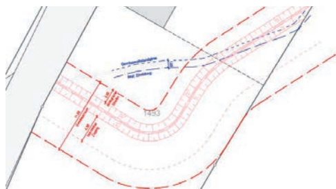
Nach Ablauf des Mitwirkungsverfahrens zum Gewässerraum Grobenentschwilerbach folgt nun die öffentliche Auflage.

Auf dem Grundstück Nr. 1493 ist der Neubau eines Einfamilienhauses geplant. Das Gewässer mit der Routennummer 20064 verläuft eingedolt von der Degersheimerstrasse (Kantonsstrasse Nr. 26) quer über die Parzelle Nr. 1493. Gemäss Stellungnahme des Amtes für Raumentwicklung und Geo-