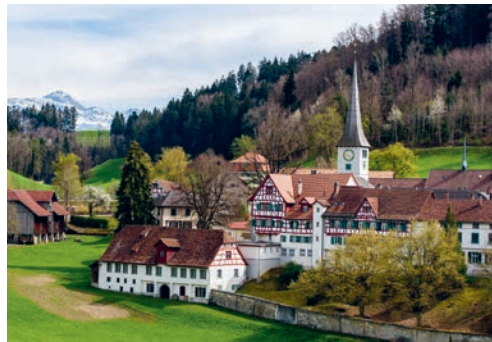
Magdenau erhält eine neue Transformatorstation.

Die St.Gallisch-Appenzellische Kraftwerke AG (SAK) plant den Neubau der Transformatorstation in Magdenau. Gleichzeitig erfolgt die Erneuerung der Leitungen zum Unterwerk Flawil sowie Anpassungen der Niederspannungsverteilnetze