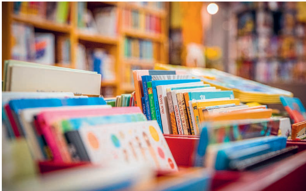
Besucherinnen und Besucher können in den bereitgestellten Medien und Spielen stöbern.

Dienstag 18.00 bis 20.00 Uhr Mittwoch 16.00 bis 18.00 Uhr Samstag 09.00 bis 11.00 Uhr