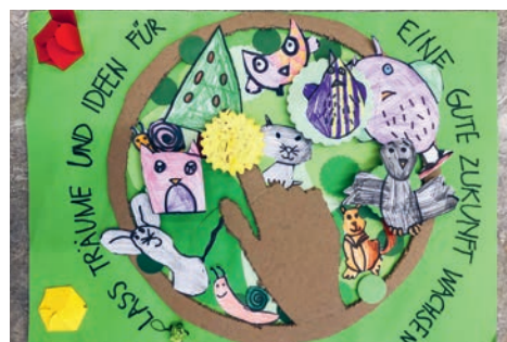
Eine schützende Hand, viel Grün und zahlreiche Tiere stehen für eine Welt, die auch in Zukunft noch Lebensraum sein soll.

Das Einschulungsjahr wird für Kinder angeboten, die zum Zeitpunkt des Übertritts in die erste Primarklasse in ihrer Entwicklung oder Teilen davon Schwächen und/oder Verzögerungen aufweisen. In diesem Zusatzjahr erhalten die Kinder die nötige Zeit und Förderung, um Entwicklungsschritte zu machen und damit die Schulbereitschaft zu erlangen. Nach dem Einschulungsjahr erfolgt in der Regel der Übertritt in die erste Primarklasse.