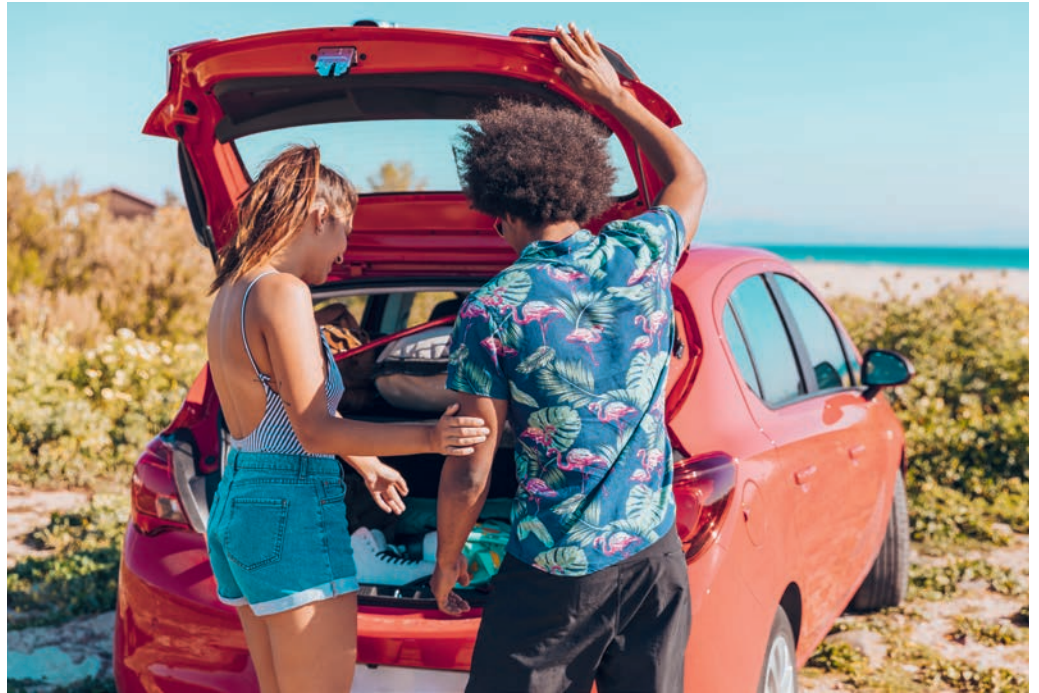
Für Ferien mit Auto, Motorrad oder Wohnmobil sollte mehr Vorbereitung eingeplant werden, damit man auch bei etwas Unvorhergesehenem entspannt bleiben kann.

Die mentale Vorbereitung dient weniger dazu, die Reise sicherer zu gestalten, sondern angenehmer. Dazu zählen Vorbereitungsarbeiten wie sich trotz Navi über den ungefähren Verlauf der Route zu informieren, Hauptverkehrszeiten zu studieren und diese in der Reiseplanung zu berücksichtigen sowie die Wetterbedingungen zu