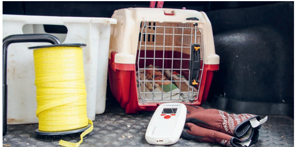
Die Grundausrüstung im Auto der Tierschutzbeauftragten besteht aus Tierbox, Kiste, Seil, Handschuhe und Chiplesegerät.

Bei ausgebüxten Haus- oder Wildtieren müssen diese zuerst eingefangen werden. Dabei müssen die Tierschutzbeauftragten oft kreativ werden und geduldig sein. Auch die unterschiedlichen Tierarten sorgen immer wieder für Abwechslung. So kann sich auch mal eine Ente in ein Kleidergeschäft verirren oder sich eine Ringel-