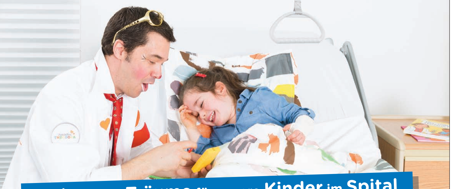
Anzeige offeriert.