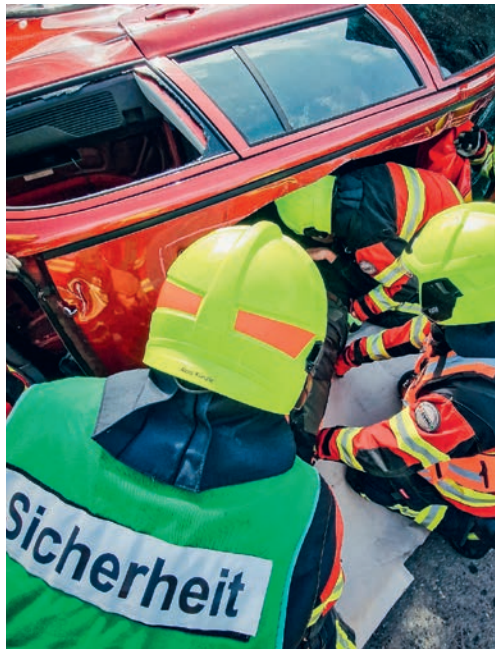
Anlässlich der Übung des Sicherheitsverbundes Region Gossau wurde auch die Strassenrettung trainiert.

FLAWIL Im Rahmen einer Übung wurde der Sicherheitsverbund Region Gossau einer ordentlichen Inspektion unterzogen. Das Gezeigte überzeugte die Inspizierenden, weshalb der Gesamteindruck mit «sehr gut» bewertet wurde.