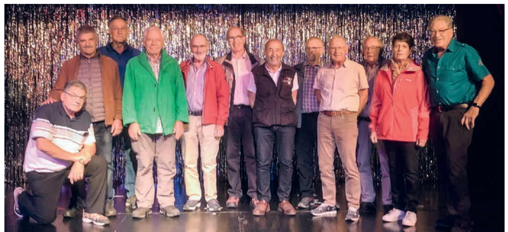
Auf der Showbühne.