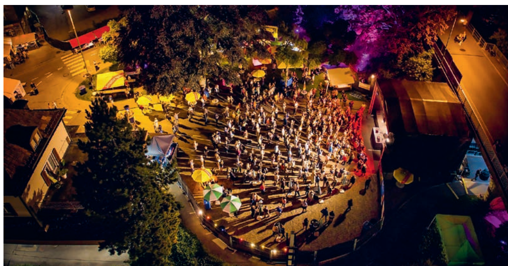
Das Festival am Gleis hat sich als fester Bestandteil des Degersheimer Kulturlebens etabliert.