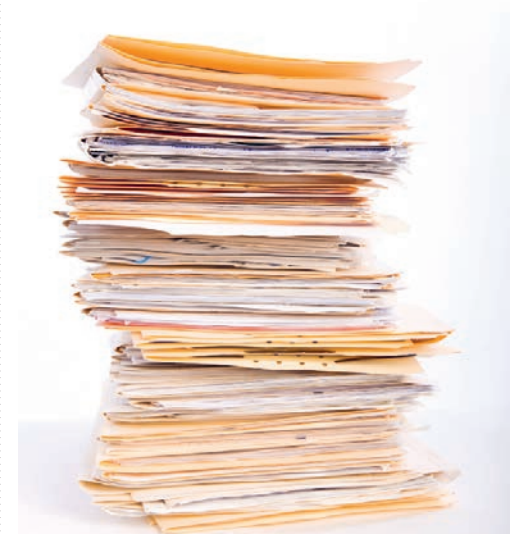
Über ein Drittel der Steuererklärungen wurden bereits eingereicht.

Steuerpflichtigen, die ihre Steuerklärung in den nächsten Tagen nicht einreichen können, wird empfohlen, eine Fristverlängerung einzuholen. Diese kann während der Öffnungszeiten telefonisch mit dem Steueramt (071 372 07 30) abgesprochen oder rund um die Uhr über www.steuern.sg.ch beantragt werden. Grundsätzlich wird keine Fristverlängerung gewährt, wenn die vorläufige Rechnung der Kantons- und Gemeindesteuern 2023 noch nicht vollständig beglichen ist.