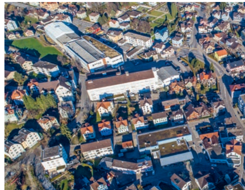
Der Sondernutzungsplan zum FLAWA-Areal Ost wird dem fakultativen Referendum unterstellt.

Grundlage für die Realisierung der Neubauten mit Wohnnutzung. Damit werden erhöhte Anforderungen an Gestaltung und Qualität sichergestellt. Neben der Sicherung der Ortsbaulichen und architektonischen Qualität kommt der Freiraumgestaltung sowie der Einpassung ins Ortsbild von Flawil eine wichtige Bedeutung zu. Vom 20. März 2024 bis 18. April 2024 lagen die Planunterlagen