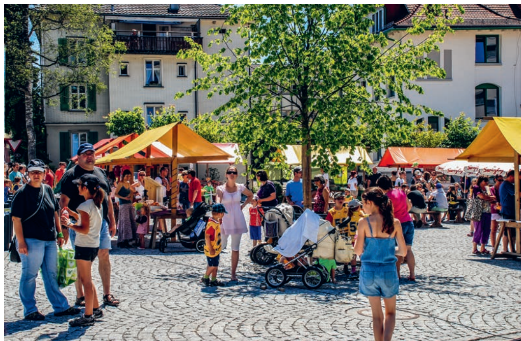
Diesen Samstag findet der Degersheimer Wochenmarkt zum ersten Mal in diesem Jahr statt.

Nebst den regelmässig präsenten Marktfahrenden bietet der Wochenmarkt auch Platz für Interessierte, die lediglich punktuell ihr Angebot präsentieren möchten. Somit sind alle, die leidenschaftlich gerne etwas nähen, basteln, backen, verzieren oder gestalten, herzlich eingeladen, ihre Ware oder Dienstleistung am Wochenmarkt anzubieten. Für Anmeldungen oder Rückfragen steht Franziska Jud gerne zur Verfügung: Telefon 071 371 11 16.