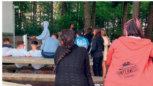
Der Chill am Grill erfreut sich grosser Beliebtheit und findet deswegen wieder regelmässig statt.

gramm. Die Jugendarbeitenden der MOJUGA-Stiftung bieten verschiedene Outdoor-Spiele und ein offenes Ohr für alle jugendlichen Anliegen. Einfach gechillt den Feierabend geniessen, sich mit Freunden treffen oder beim gemeinsamen Gespräch auf neue Ideen kommen – das alles und mehr läuft am Chill am Grill!