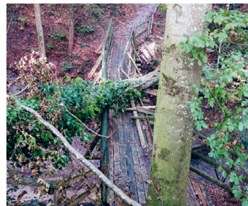
Die Brücke über den Aubach bei der Techenwis in Magdenau soll nicht mehr erneuert werden.

2024 bis 18. Mai 2024 in der Gemeinderatskanzlei und auf der Homepage der Gemeinde zur Einsichtnahme auf (siehe Inserat auf Seite 4 dieser Ausgabe). Eingaben im Zusammenhang mit der Mitwirkung können bis am 18. Mai 2024 schriftlich an den Gemeinderat, Hauptstrasse 79, 9113 Degersheim, oder per E-Mail an gemeinde@degersheim.ch eingereicht werden. Fragen zum Projekt werden von der Bauverwaltung, Herr Armin Fässler, Telefon 071 372 07 90, gerne beantwortet.