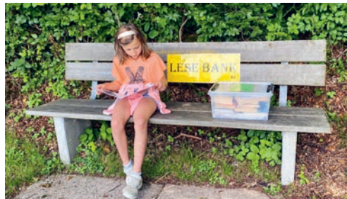
Die Lesebank-Aktion der Bibliothek Ludothek bietet der Bevölkerung spannende Unterhaltung im gesamten Gemeindegebiet.

Am 23. April ist der Weltbuchtage, der von der UNESCO im Jahr 1995 ins Leben gerufen wurde. Es ist der jährliche Feier- und Aktionstag für das Lesen, für Bücher, für die Kultur des geschriebenen Wortes und auch für die Rechte ihrer Autoren. Die Bibliothek Ludothek nutzt dieses Ereignis, um wiederholt im Gemeindegebiet von Degersheim auf Park- und Wanderbänkli bis zu den Sommerferien gut gefüllte Kisten zu deponieren. Spannende Bücher, kurzweilige Zeitschriften und unterhaltsame Comics sind darin zu finden. Stöbern sie in der Kiste und lassen sie sich verführen. Sie können die Lektüre gleich an Ort und Stelle lesen oder sie mit nach Hause nehmen. Sie