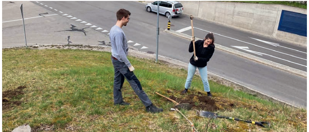
Zahlreiche Freiwillige halfen dabei, die dutzenden Bäume, Sträucher und Hecken in Flawil zu pflanzen.