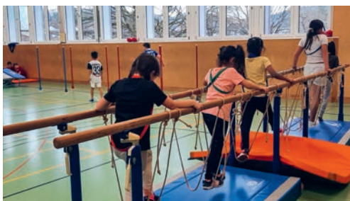
Durchschnittlich 27 Kinder besuchten jeweils am Sonntag das «OpenSunday» in der Turnhalle Enzenbühl.

Um den Kindern aus Flawil in den Herbst- und Wintermonaten Raum zur sportlichen und spielerischen Bewegung zu bieten, wurde vor drei Jahren das «OpenSunday» Flawil ins Leben gerufen. Im Herbst 2023 startete das Projekt in die dritte Saison. Bis Ende März 2024 konnten sich die Kinder der Primarstufe, auch jene der Heilpädagogischen Schule, an 18 Sonntagnachmittagen in der Turnhalle Enzenbühl treffen und sich gemeinsam sportlich betätigen. Jeder Sonntag bot spannende Gemeinschaftsspiele und abwechslungsreiche Bewegungslandschaften zum Toben, Springen, Klettern und Balancieren. Mit dem breiten Spiel- und Sportangebot wurde die Freude an der Bewegung gefördert.