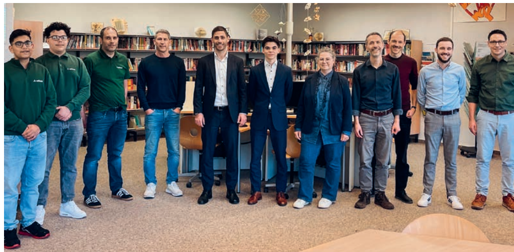
Lehrpersonen der zweiten Sekundarstufe sowie Firmenvertreter/-innen.

Wicon (Andwil) sowie der St.Galler Kantonalbank. Die Lehrverantwortlichen sowie Lernende erklärten den Schülerinnen und Schülern der zweiten Sekundarstufe aus erster Hand, wie die Berufsausbildung in verschiedenen Berufen funktioniert und worauf es im Bewerbungsprozess ankommt. Auf diese Weise konnte jeder und jede Jugendliche einen Einblick in zwei Firmen und unterschiedliche EFZ-Lehren erhalten.