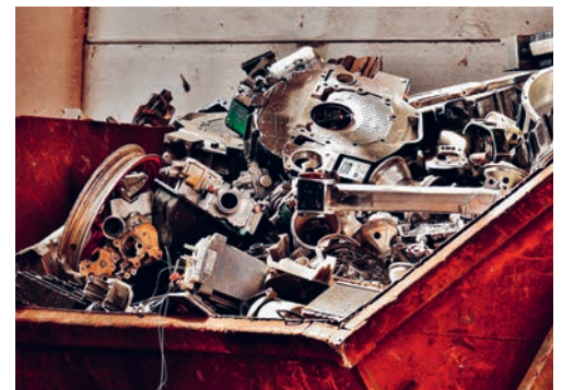
Das Altmetall kann neu an drei ausgewählten Standorten entsorgt werden.