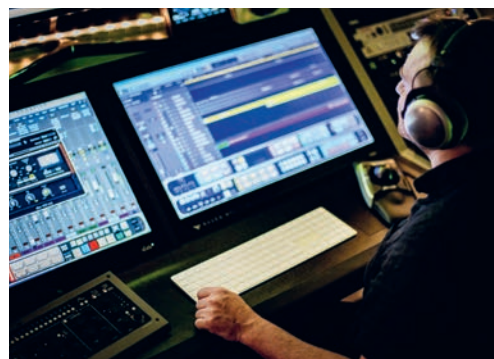
Auch wie man am Computer Musik macht, wird an der Musikschule Flawil gelehrt.

Auch alle anderen Instrumente, die wir in den letzten Wochen in dieser kleinen Serie vorgestellt haben, können an diesem Morgen ausprobiert werden. Ausserdem gibt es wieder einen Wettbewerb mit tollen Preisen. Anmeldungen zum neuen Semester nimmt die Musikschule bis zum 31. Mai 2024 entgegen. Unterrichtsbeginn ist nach den Sommerferien.