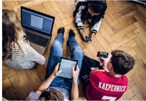
Für Eltern ist der Umgang ihrer Kinder mit digitalen Geräten oft eine Herausforderung.